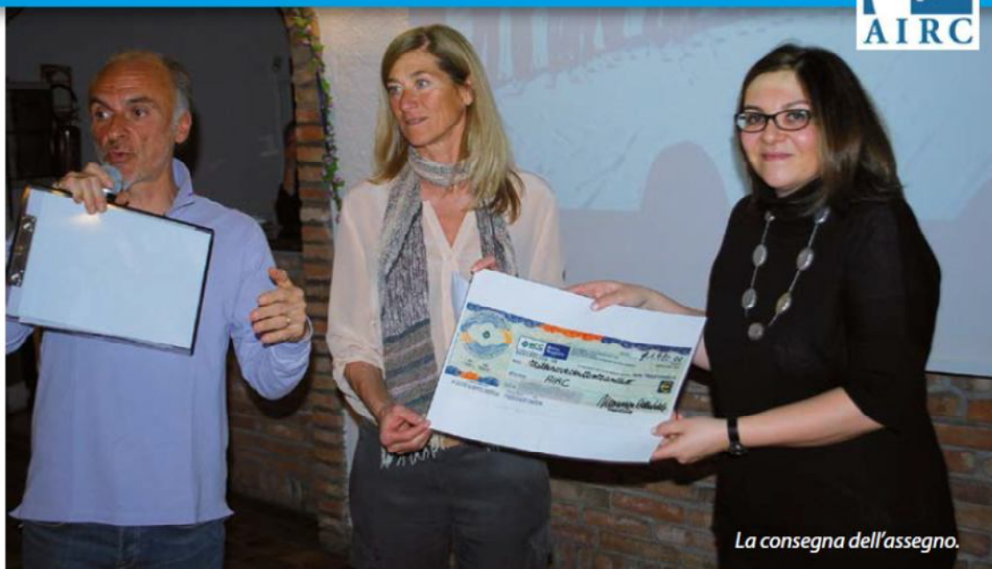
La consegna dell'assegno.